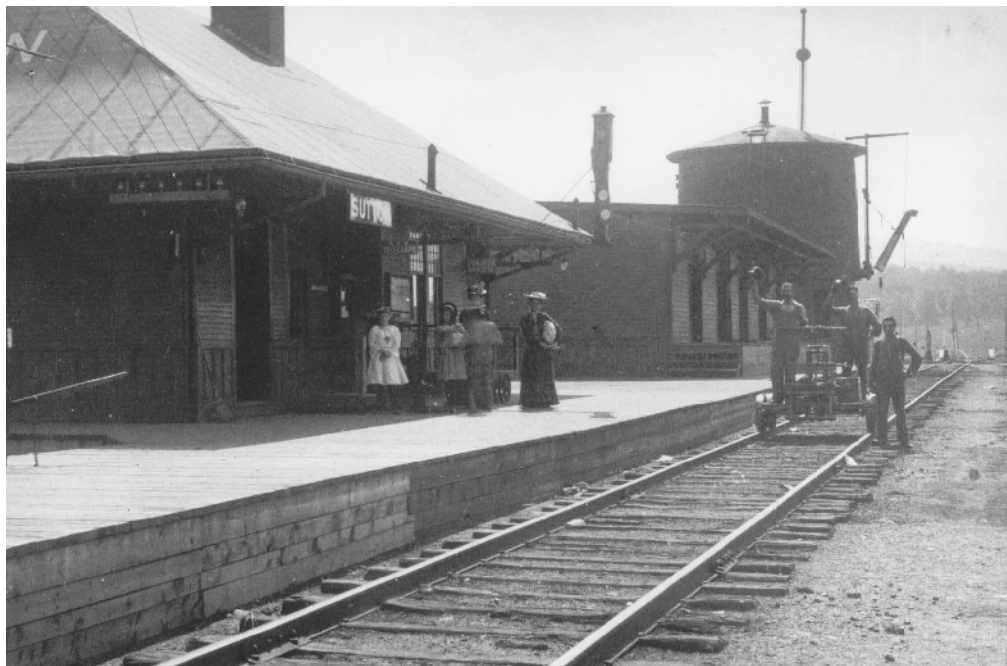
La gare du Canadien Pacifique à Sutton et son château d'eau au début du 20 e siècle.

Soutien graphique : Dominic Duffaud Impression : Impressions D.F., Cowansville (Québec)